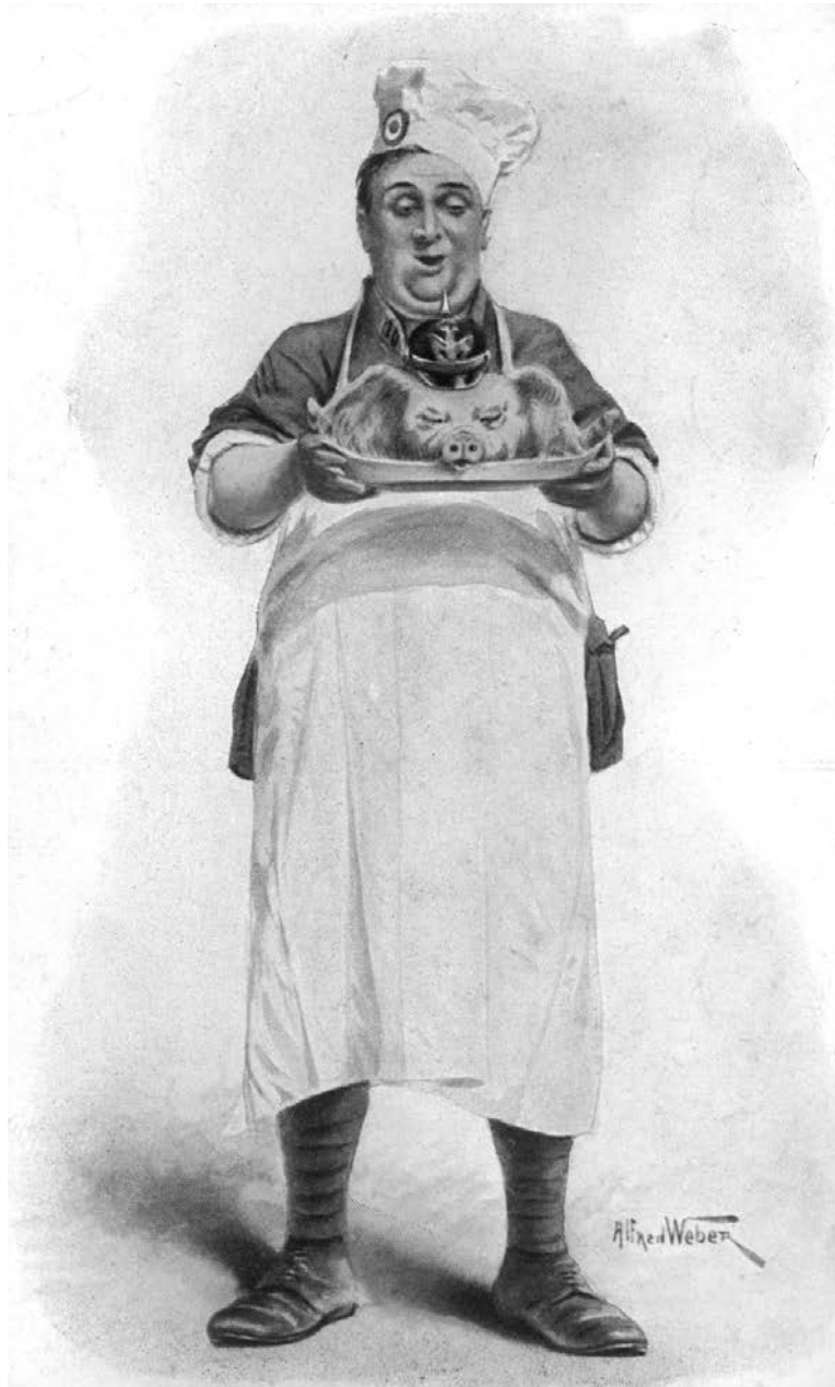
Na het uitbreken van de oorlog verschenen diverse spotprenten. De bezetter werd vaak met het varken vereenzelvigd.