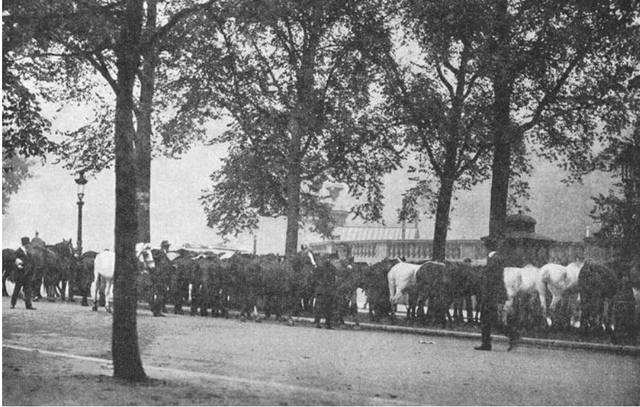
Het Duitse leger eiste veel paarden op voor de oorlogsvoering. De Belgische landbouw viel langzaam stil zonder trekkracht.

op de zwarte markt. 13 De Britten dreigden in 1915 het CRB en NHVC niet langer te bevoorraden als de Duitsers grote delen van de Belgische landbouwogst bleven opeisen. In 1916 kwam er een conventie tussen Groot-Brittannië, het CRB en het Generaal-Gouvernement die bepaalde dat Duitsland geen ingevoerde producten bestemd voor het NHVC mocht opeisen. Onder het mom van ‘lopende contracten’ via Belgische handelaars gingen de opvorderingen toch voort. Voor groenten, paarden en kunstmeststoffen veranderde er niets aangezien Duitsland argumenteerde dat deze producten reeds voor de oorlog naar Duitsland werden geëxporteerd en dat oorlog daar niets aan veranderde. De conventie van 1916 gold enkel voor het Generaal-Gouvernement en niet voor het Etappengebied waar de landbouw het nog moeilijker had.