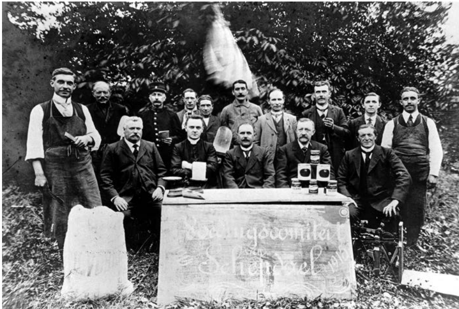
Lokale comités van het NHVC stonden in voor de plaatselijke voedselverdeling. Op de foto poseert het comité van Schepdaal (Dilbeek). De Amerikaanse vlag, de blikken zalm en bonen en de weegschaal verwijzen naar ingevoerd CRB-voedsel.

Toen in de zomer van 1914 de oorlog uitbrak, was de fotografie al goed ontwikkeld. Voor de oorlog hadden welgestelde burgers zich een zakcamera aangeschaft. Frappante momenten werden vastgelegd op glasplaatjes. 210 Veel van deze foto's belanden in privé-albums en duiken nu opnieuw op. Ook perscamera's lieten zich niet onbetuigd en brachten de beelden van de strijd op spectaculaire wijze in beeld. Fotografie was trouwens een sterk propagandamiddel. De Fotografische Dienst van het Belgisch Leger, opgericht eind 1915, had expliciet als doel om levensechte beelden te maken om de Verenigde Staten te overtuigen om deel te nemen aan de strijd. Ook vanuit Britse en Duitse hoek werden fotografische diensten opgericht.