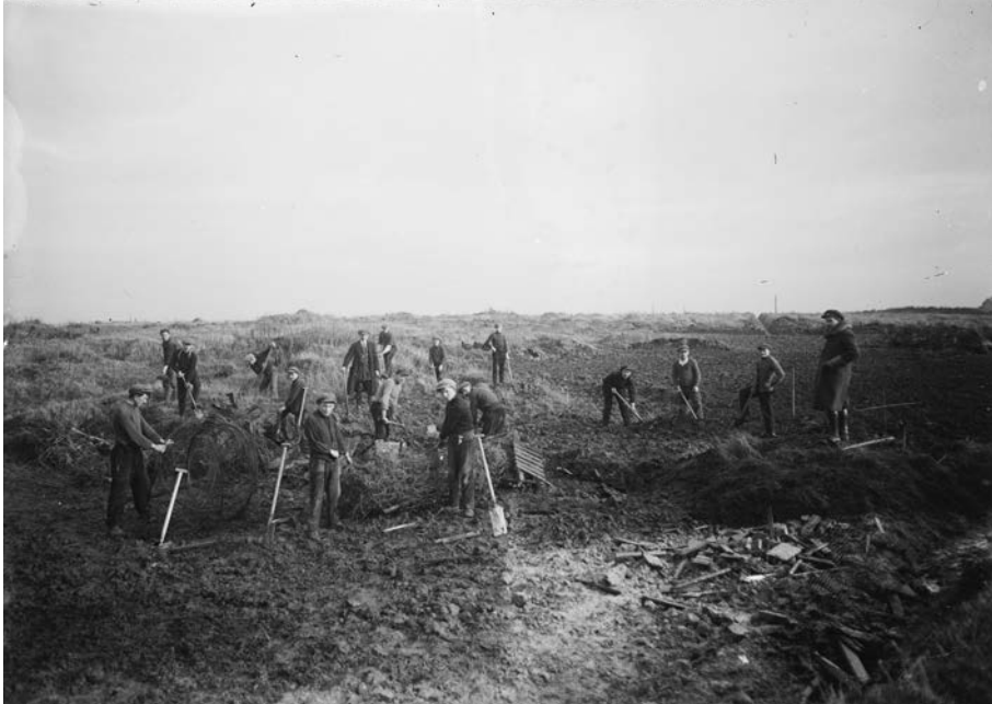
Het landbouwherstel na de oorlog vergde een grondige aanpak. De bodem werd gesaneerd van prikkeldraad, hout- en steenafval en oorlogsmateriaal.

bewijsstukken - inclusief een beschrijving van het paard - voor te leggen als zij hun dier terug wilden. Concreet vroeg België 10.200 paarden, 92.000 runderen, 20.200 schapen en 15.000 varkens terug. De gevraagde dieren vormden nog geen 10 % van de veestapel die verloren ging tijdens de oorlog. 28 De dieren die terugkeerden naar België waren eerst en vooral bestemd voor de verwoeste streken. Na de uitbraak van varkenspest in Duitsland in 1919 werden de gevraagde varkens vervangen door schapen, geiten en kippen. Door ziekten en administratieve problemen verliep de teruggave van het vee niet vlot. De verdragsbepalingen bij de Vrede van Versailles voorzagen ook in de teruggave van landbouwmachines en -gereedschap. Over een teruggave of vergoeding voor alle opgeëiste akkerbouwgewassen, veevoeder en meststoffen vermeldde het verdrag niets, hoewel er zeker compensaties in natura werden gedaan.