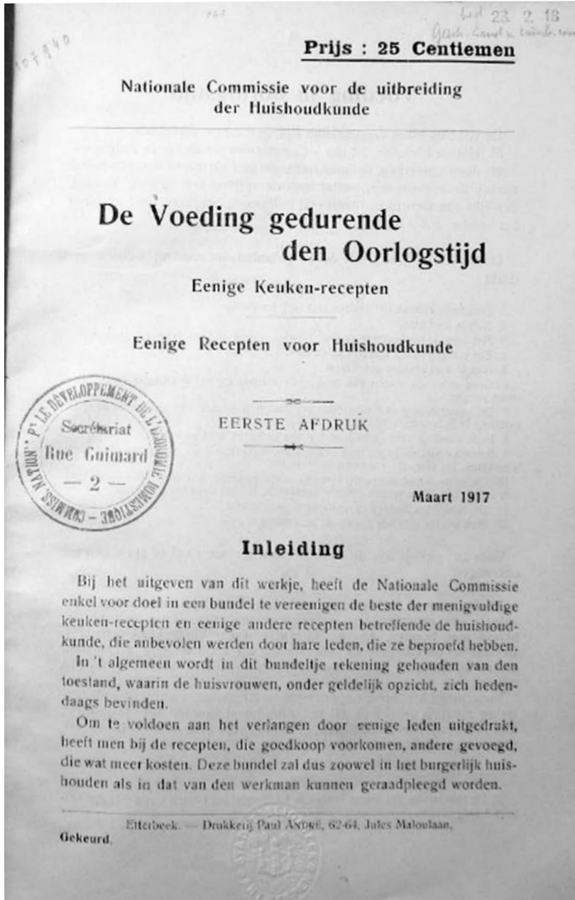
Tijdens de oorlog verschenen veel brochures en infogidsen over rationele voeding en met kooktips. Dit is de titelpagina van De Voeding gedurende den Oorlogstijd (1917).